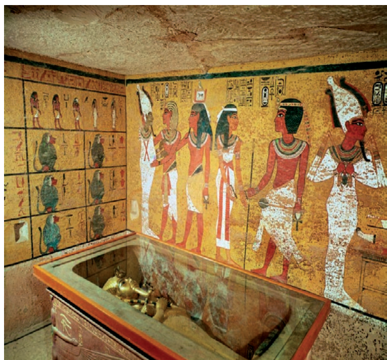
PHOTO DE LA TOMBE