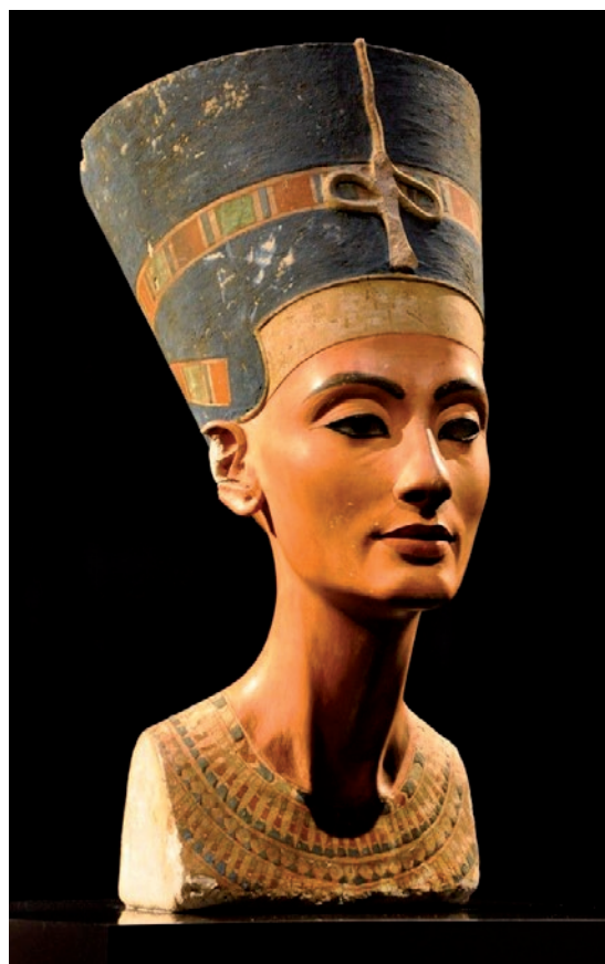
RÉALISÉ PAR SCULPTEUR THOUTMOSE

Le tombeau de Toutankhamon est reconstitué avec une série exceptionnelle de copies des pièces authentifiées par le Supreme Council of Antiquities Replica Production Unit de son trésor, réalisées en Égypte par les ateliers du Ministère des Antiquités égyptiennes . Bienvenue au cœur de la tombe telle qu'elle a été découverte en 1922 ! Cette plongée en Égypte antique est rendue d'autant plus immersive par la reproduction d'une partie du Palais Royal de l'antique Amarna, où le jeune Toutankhamon a passé une partie de son enfance, et à la réplique de l'atelier de Thoutmose , sculpteur officiel du pharaon maudit, Akhénaton, père de Toutankhamon. Deux premières mondiales !